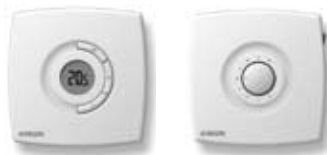
Prigo, elektroninen termostaatti, tasoasennus