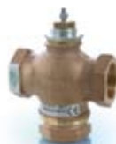
2- ja 3-tiesäätöventtiilit