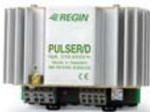
PULSER, Säädin DIN-kiinnitykseen