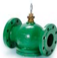
2- ja 3-tielaippaventtiilit

Säätöventtiilit jäähdytys- ja lämmitysjärjestelmiin. Laippaventtiilit DN 25...150.