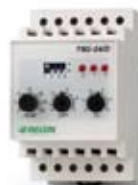
DIN-kiskokiinnitteinen termostaatti, lämmitys/jäähdytys