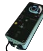
Peltitoimilaite 15 Nm