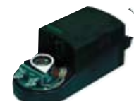
Peltitoimilaite 18 Nm